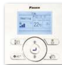
En option (BRC073)