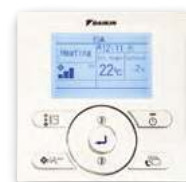
En option (BRC073)